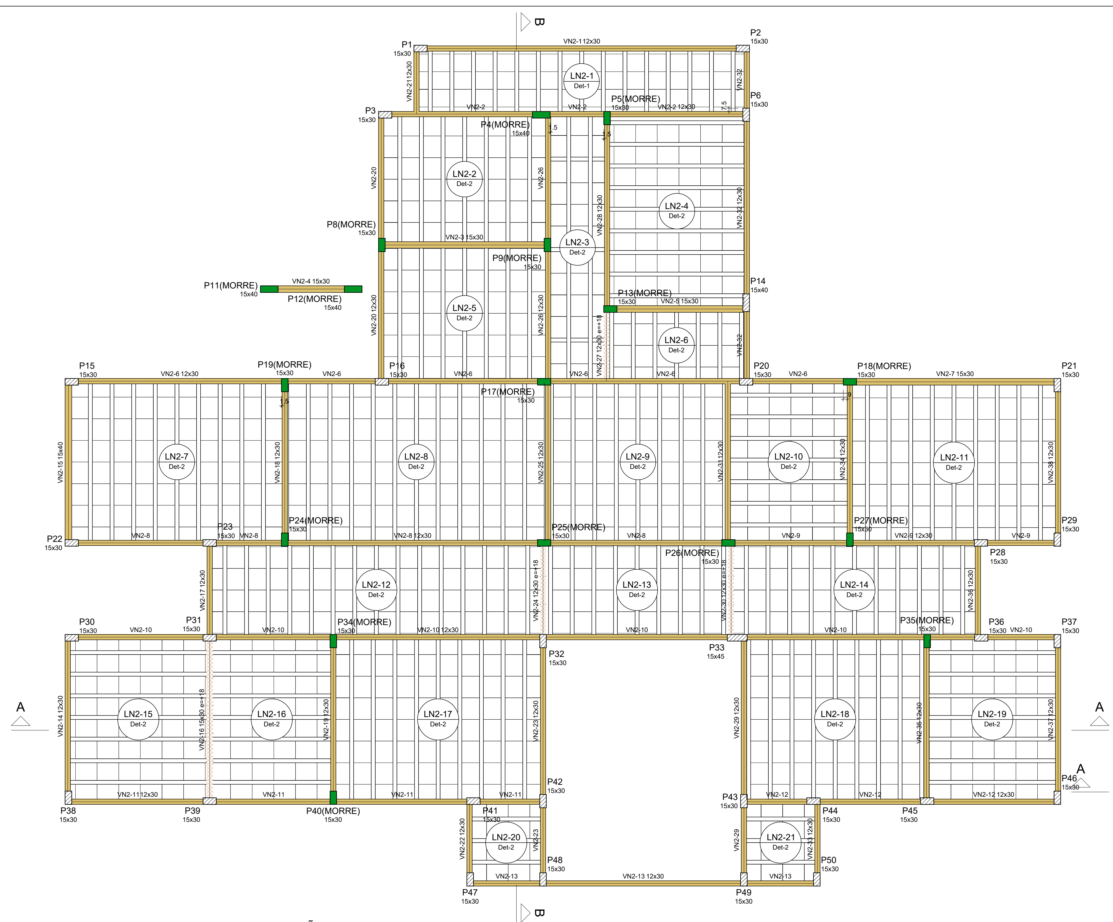
FORMA PAVIMENTO N2-RESP EDIFICAÇÃO (NÍVEL 295) ESCALA 1:50